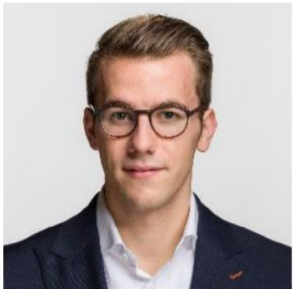
Nationalrat FDP Andri Silberschmidt